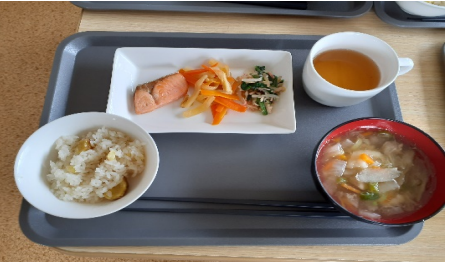
まいたけご飯・たら汁