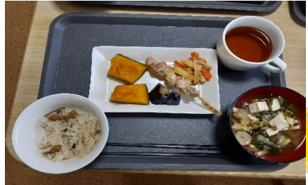
栗ご飯・すいとん汁